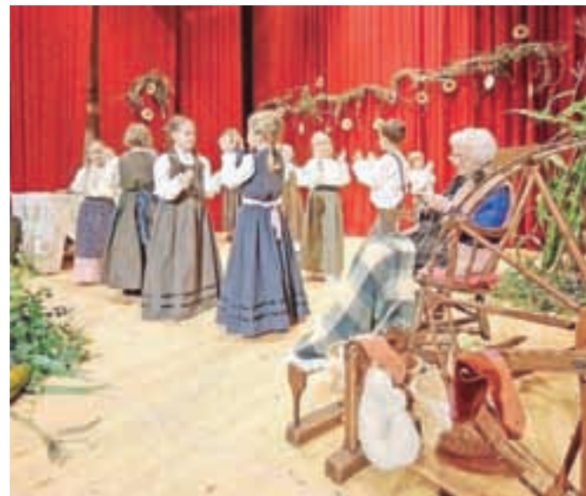
Učenci drugega razreda Waldorfske šole Radovljica med nastopom

pevanja in počutijo se kot velika družina. V predstavi je duh starih časov obudila babica. Med pletenjem nogavice je pripovedovala zgodbe iz svojega otroštva, otroci pa so potem s pesmijo in rajanjem