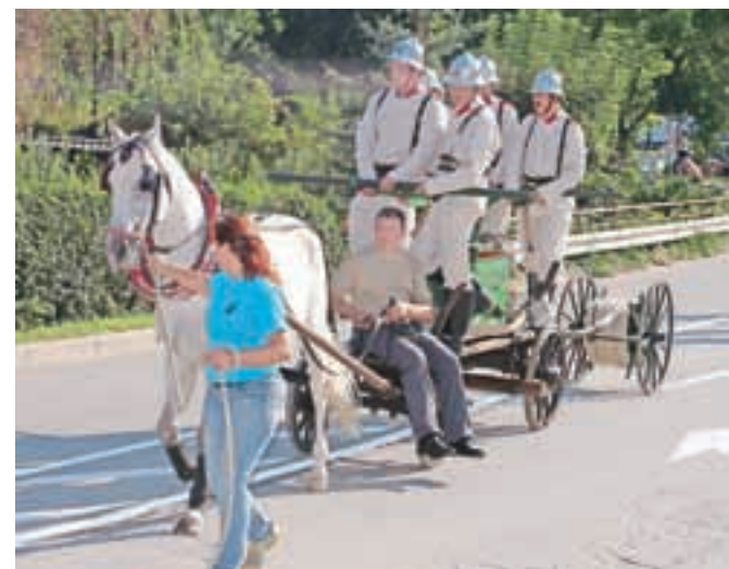
Stara črpalka s konjsko vprego