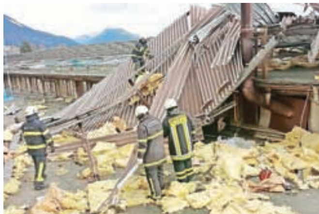
Veter je v noči z 10. na 11. november dobesedno odpihnil streho s proizvodne dvorane podjetja Neros.

tivna zunanja igrala za ustanove z javnimi površinami, šole, vrtnice, za hotele, gostišča in mnoge posameznike. Izdelana so iz varnih materialov, po evropskih standardih in certifikatih,« pojasnjuje lastnica in direktorica uspešnega podjetja, ki ima več kot trideset zaposlenih in je prav v tem času pred novim izzivom. Odločili so se, da bodo svoj program še širili, in sicer na področje avtomobov. »Vsi smo usmerjeni k enemu samemu poslanstvu: približati se strankam in uresničiti njihove vizije. Naša dejavnost je pravzaprav kompleksen proces od razvoja ideje do končne izvedbe.«