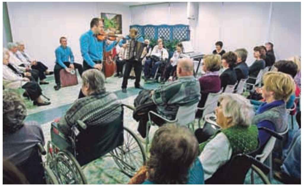
Prijetno vzdušje na tradicionalnem prednovoletnem srečanju s svojci