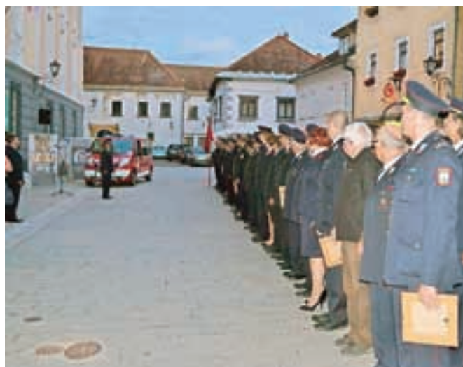
Prevzem novega vozila