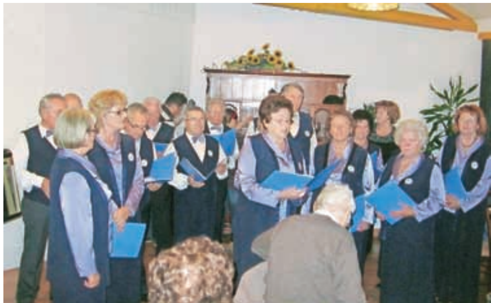
Na srečanju je pel mešani pevski zbor Slavček upokojenskega društva Lesce.

Udeležence so pozdravili organizatorji in gostje, potem pa so se prepustili kulturnemu programu z mlado pev-