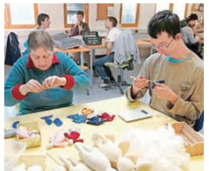
Vso jesen so v delavnicah VDC Radovljica nastajali čudoviti izdelki iz gline in blaga, ki jih lahko kupite v Trgovinci.