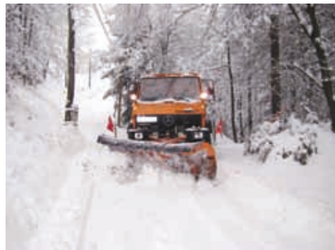
Pluženje javne poti

Dovoz k stanovanjskim hišam čistimo lastniki sami. Čiščenje javnih površin v gosto naseljenih stanovanjskih območjih (pluženje in odvoz snega) izvajamo napovedano v nočnem času. Največjo težavo predstavljajo vozniki, ki vozila nepravilno parkirajo na pločniku ali na cesti, saj s tem onemogočajo hitro in učinkovito odstranjevanje snega.