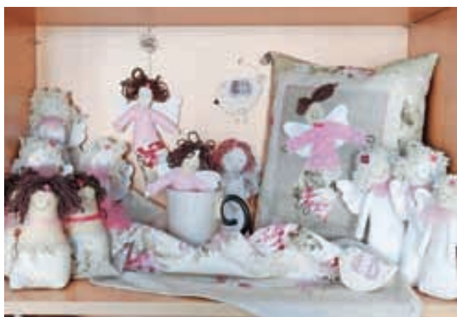
Punčka iz cunj, pisana blazina, unikatna skodelica za čaj ... čudovita praznična darila, narejena in izbrana s srcem ...