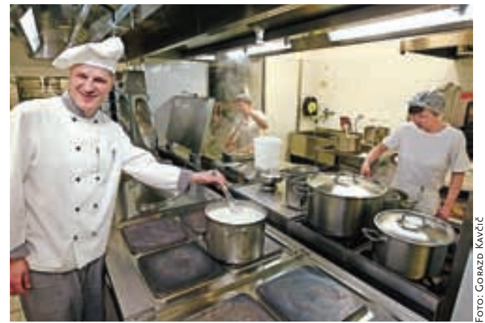
Odprli so tudi nove, popolnoma prenovljene kuhinje.

že dolgo zavedata razvojnih možnosti starejših ter velikega pomena, ki ga imata aktivno in kakovostno preživljanje časa.«