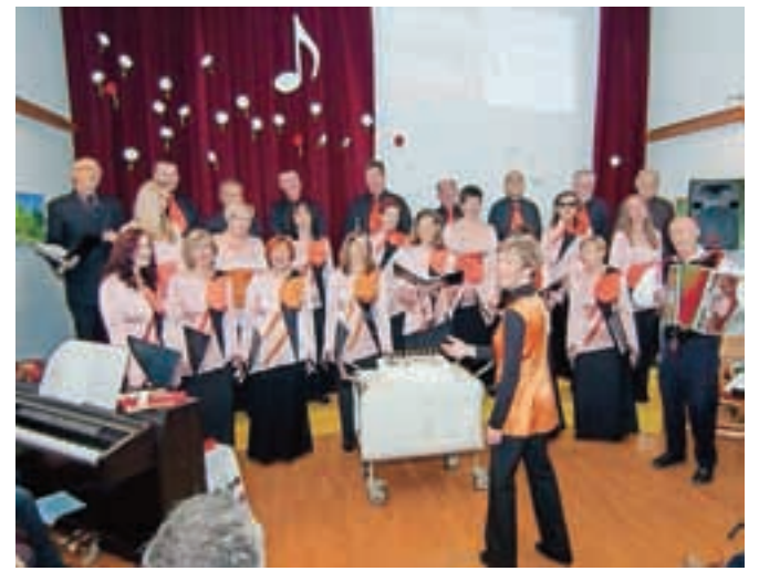
Mešani pevski zbor Lipnica

Z zborom bogatite glasbeno dogajanje v Lipniški dolini pa tudi v občini Radovljica.